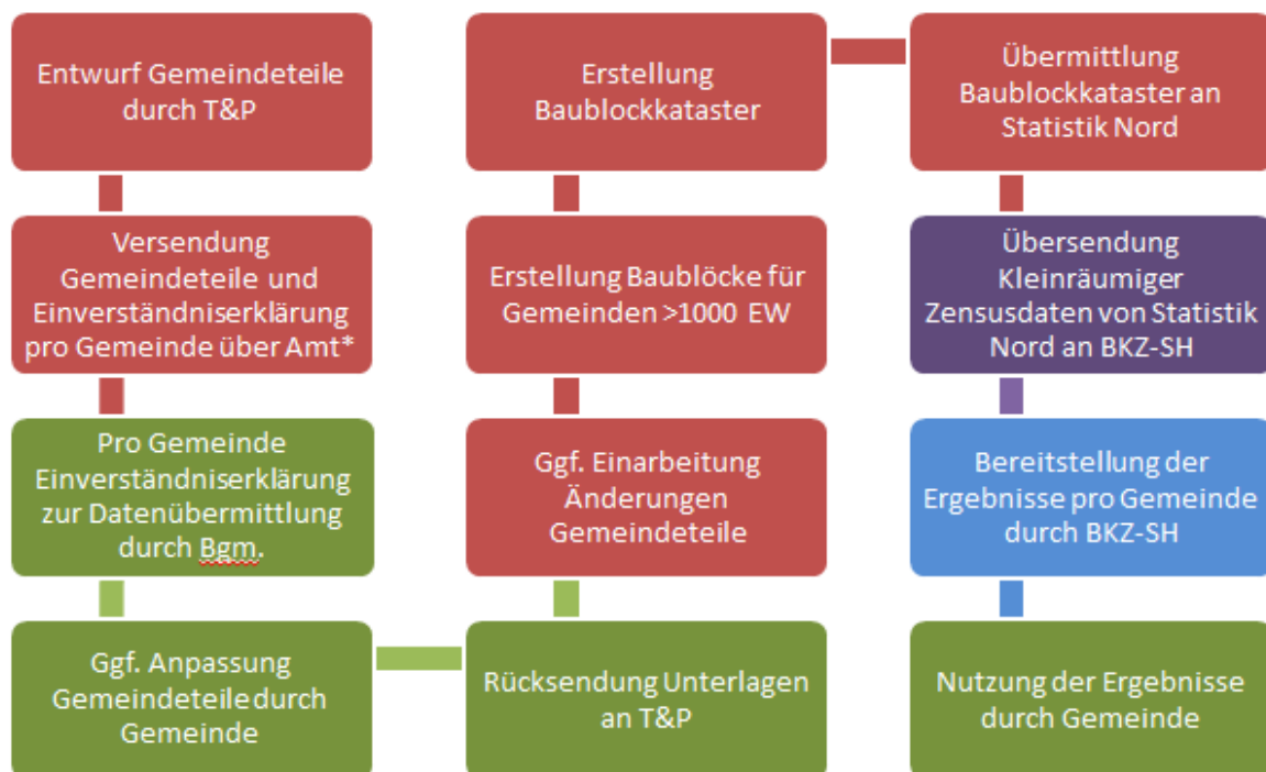
Abb. 2: Ablauf der Baublockerstellung

*Bzw. direkt bei amtsfreier Gemeinde/Stadt